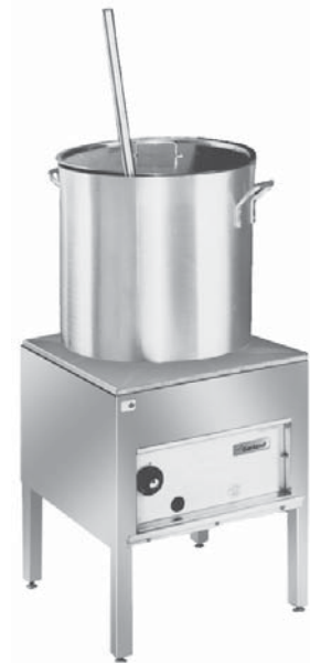
Model G20-SP (stock pot not included)