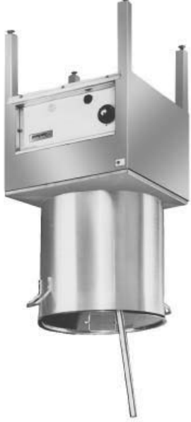
Model G20-SP (stock pot not included)