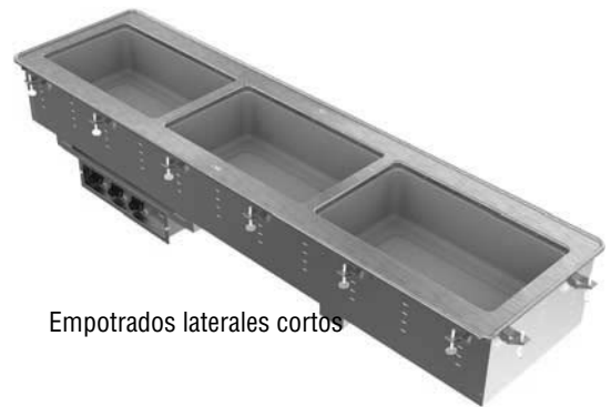
Empotrados laterales cortos

Gracias por comprar este equipo Vollrath. Antes de usar el equipo, lea y familiarícese con las siguientes instrucciones de operación y seguridad. CONSERVE ESTAS INSTRUCCIONES COMO REFERENCIA PARA EL FUTURO. Conserve la caja y embalado originales. Deberá utilizarlos para devolver el equipo en caso de que requiera reparaciones.