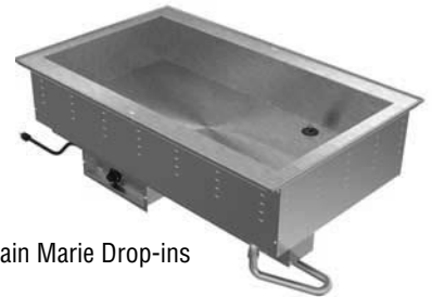
Bain Marie Drop-ins