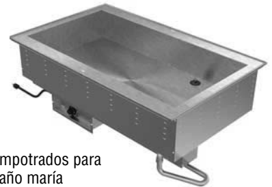
Empotrados para baño maría