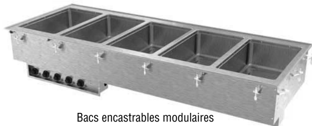
Bacs encastrables modulaires